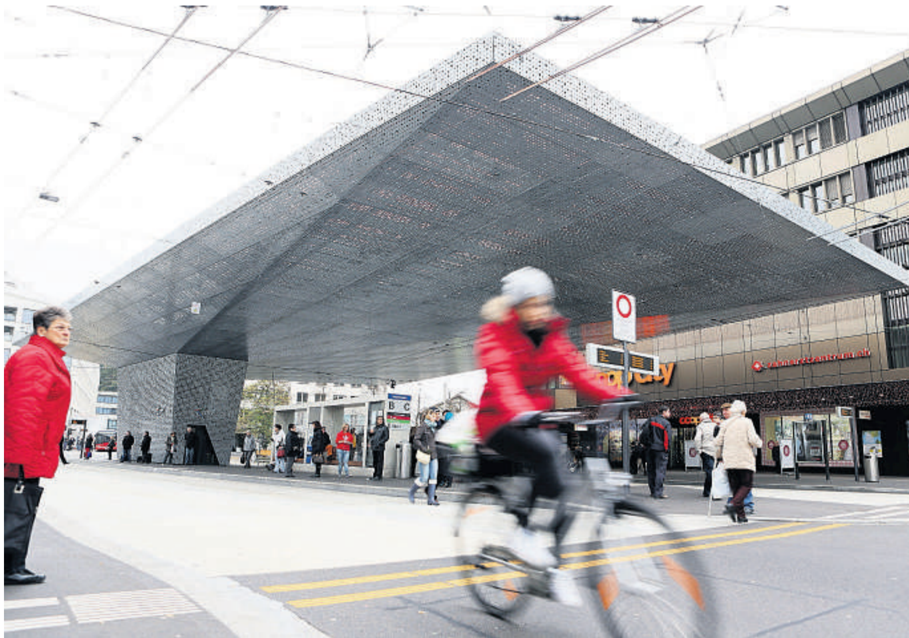
Rund 180 000 Löcher hat Winterthurs neues Wahrzeichen: Das 300 Tonnen schwere Pilzdach auf dem Bahnhofplatz wurde im Juni eröffnet. (16. November 2013)